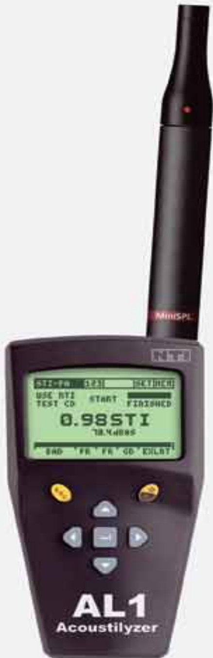
AL1 plus MiniSPL